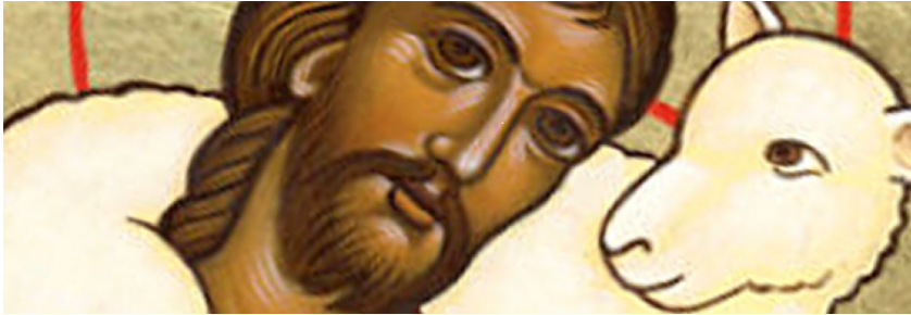
(Matt 16, 13-20)

La question est posée par Jésus lui-même à ses disciples. « Pour la foule qui suis-je? » Et ceux-ci de lui rapporter toutes les rumeurs qui courent à son sujet. Pour les uns il est Jean Baptiste, pour d'autres Élie et pour d'autres encore un prophète d'autrefois qui serait ressuscité. C'est dire que Jésus avait frappé l'imagination d'un peu tout le monde par ses paroles, ses gestes et ses réalisations tout à fait spéciales. Jésus ne fait aucun commentaire sur ces bruits qui courent mais il retourne tout simplement la question à ses disciples. Il leur demande. « Et vous, qui dites-vous que je suis? Qui suis-je pour vous? »